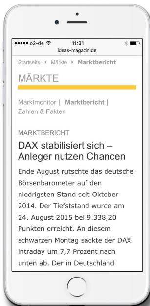
Screenshot 01: Zunehmender Bedarf Magazin-Inhalte mobil abzurufen

Titelbild: Mühelos vom Heft auf's Handy – ideas Magazin mobilisiert das Corporate Publishing